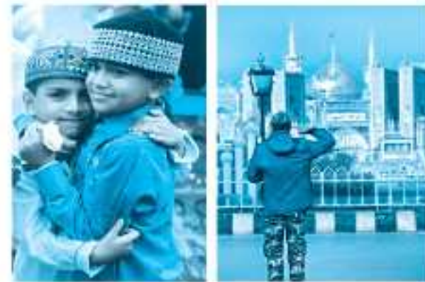
توجه انسان در انجام کنش به معنای آن

• کنش انسان برخلاف فعالیت سایر مخلوقات معنادار است. انسان‌ها با توجه به معنای کنش خود، آن را انجام می‌دهند.