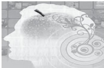
شکل ۲. نماد سلامت روان