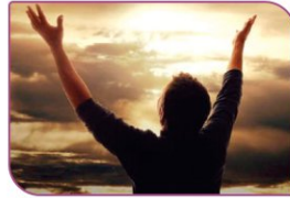
آگاه باشید تنها یاد خدا آرام‌بخش دل‌هاست