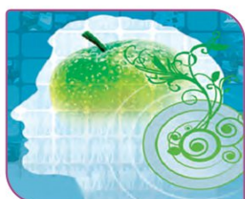
نماد سلامت روان