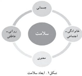
شکل ۱. ابعاد سلامت

همان‌طور که در متن قبل خواندید، سلامت مفهومی است چند وجهی و در عین حال یکپارچه که وجوه مختلف آن کاملاً بر هم تأثیر می‌گذارند و در تعامل با یکدیگر سلامت فرد را تضمین می‌کنند. (شکل ۱) به عبارت دیگر، ابعاد سلامتی عملاً قابل تفکیک از هم نیستند، چنان‌که برخی افراد علی‌رغم اینکه علامت آشکاری از یک بیماری جسمی و روانی ندارند ولی با قدری تأمل در رفتار آنها می‌توان خستگی، اضطراب، افسردگی، ناامیدی و عدم رضایت را در وجودشان مشاهده کرد که می‌تواند سلامت آنها را تهدید کند.