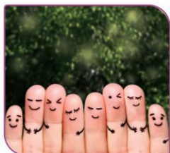
فرد سالم از نظر اجتماعی، نقش‌های اجتماعی خود را توأم با احساس آرامش و رضایت‌مندی انجام می‌دهد.