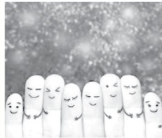
شکل ۳. فرد سالم از نظر اجتماعی، نفع‌های اجتماعی خود را توأم با احساس آرامش و رضایتمندی انجام می‌دهد.

یکی از دلایل ابتلای افراد به بیماری‌های روحی-روانی که به دنبال خود مشکلات جسمانی و اجتماعی را نیز به بار می‌آورد، داشتن احساس بوجی و بی‌هدفی در زندگی است که خود ناشی از نداشتن سلامت معنوی است. افراد سالم از نظر معنوی اهدافی اساسی در زندگی دارند، فراتر از جهان مادی به جهان معنوی نیز می‌نگرند، آرامش دارند و به دیگران این آرامش را نیز منتقل می‌کنند. سطح بالایی از ایمان به خدا، امیدواری، تعهد، کمال‌جویی، پایبندی به اخلاقیات و هدف داشتن در زندگی و اعتقاد به معنویت و معاد از نشانه‌های سلامت معنوی است (شکل ۴).