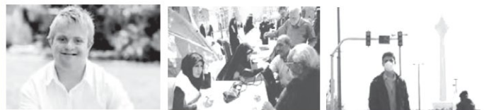
شکل ۵. عوامل مؤثر بر سلامت

خانواده‌ای با سابقه ژنتیکی بیماری قلبی-عروقی متولد می‌شود احتمال ابتلای او به این بیماری بیشتر است. یا افرادی که در کشورهای محروم و فقیر زندگی می‌کنند به دلیل عدم دسترسی به امکانات بهداشتی و درمانی کافی در مقایسه با کشورهایی که دارای امکانات بیشتری هستند، بیشتر در معرض عوامل تهدیدکننده سلامت قرار دارند. به‌طور کلی چهار عامل سبک زندگی، عوامل ژنتیکی و فردی، عوامل محیطی و دسترسی به خدمات بهداشتی-درمانی عوامل مؤثر بر سلامت هستند (شکل ۵).