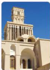
بادگیر دو طبقه ابرکوه - استان یزد

تصویری که مشاهده می‌کنید بادگیری در استان یزد را نشان می‌دهد. با دقت به این تصویر و ارتباط آن با مبحث «روابط متقابل انسان و محیط» متوجه می‌شویم که انسان‌ها برای برطرف کردن نیازهای خود در طول تاریخ، محیط را تغییر داده‌اند و در نتیجه، محیط طبیعی به محیط جغرافیایی تبدیل شده است.