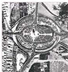
میدان آزادی - تهران ۱۳۶۵