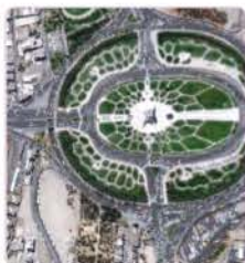
میدان آزادی - تهران ۱۳۹۵