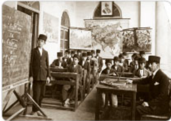
رضاشاه دانش‌آموزان را هم به استفاده از کلاه پهلوی مجبور کرد

رضاشاه به نام تمدن و تجدد و مبارزه با کهنه‌پرستی به یک شکل کردن لباس‌ها و برداشتن حجاب بانوان اقدام کرد. از نظر رضاشاه مهم‌ترین راه پیشرفت و توسعه کشور، تقلید از غرب و اشاعه فرهنگ غربی است ← به تقلید از آتاتورک (رئیس‌جمهور ترکیه) به مبارزه با همه سنت‌های اسلامی پرداخت.