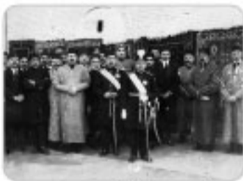
احمدشاه قاجار به همراه رضاخان و رجال دریاری

در نتیجه این دلایل، مأموران انگلستان در ایران تصمیم گرفتند تا شخص مورداعتماد خود را به حکومت برسانند تا از طریق او بتوانند به صورت غیرمستقیم اهداف خود را در ایران پیاده کنند.